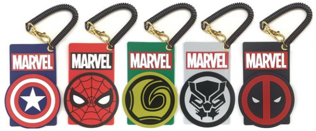
シリコン IC カードケース(全 5 種) 各 1,800 円+税