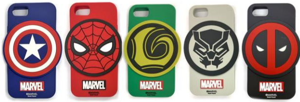
シリコン iPhone ケース(全 5 種) 各 2,800 円+税 ※iPhone8/7/6/6s 対応