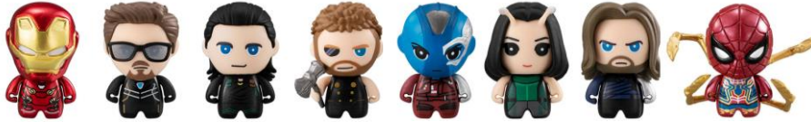
ガシャポン コレキャラ! マーベル アベンジャーズ 02(全 8 種) 1 回 300 円(税込) <12 月 21 日(金)より発売>