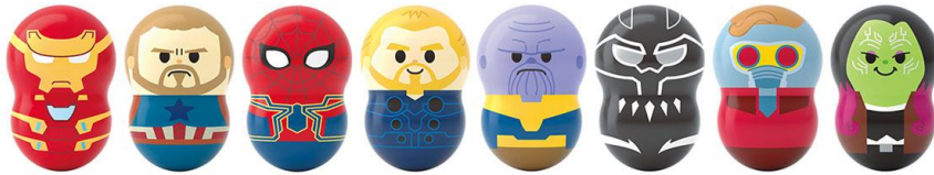
クーナッツ MARVEL(全 8 種) 200 円+税 ※ラムネ菓子 1 個入 <12 月 24 日(月・祝)より発売>